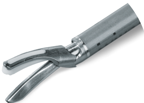
Nůžky pro disekci tkání

Sestavení autoklávovatelného převodníku a jednorázové rukojeti je velmi jednoduché, systémem Plug n Play bez použití klíče.